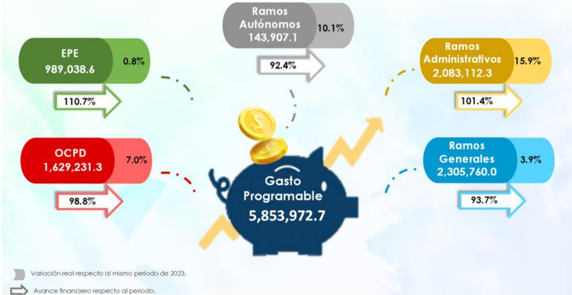
Gráfica 1 Gasto Programable en clasificación Administrativa, Enero-Noviembre 2024 (Millones de pesos y porcentajes)

FUENTE: elaborado por CEFP Ifigenia Martínez y Hernández, con información de la SHCP, Información de Finanzas Públicas y Deuda Pública a Noviembre 2024.