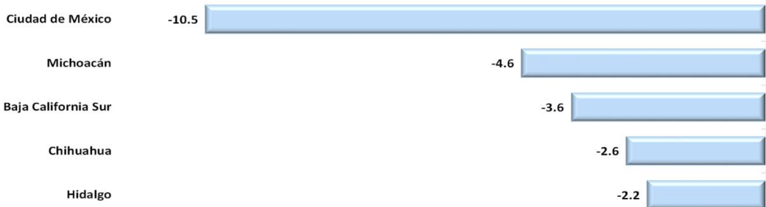
Entidades Federativas con las Menores Tasas de Crecimiento de las Aportaciones Federales* Pagadas contra las Calendarizadas, a Abril 2022 (porcentaje)

*Incluye el Ramo 25, Previsiones y Aportaciones para los Sistemas de Educación Básica Normal, Tecnológica y de Adultos.