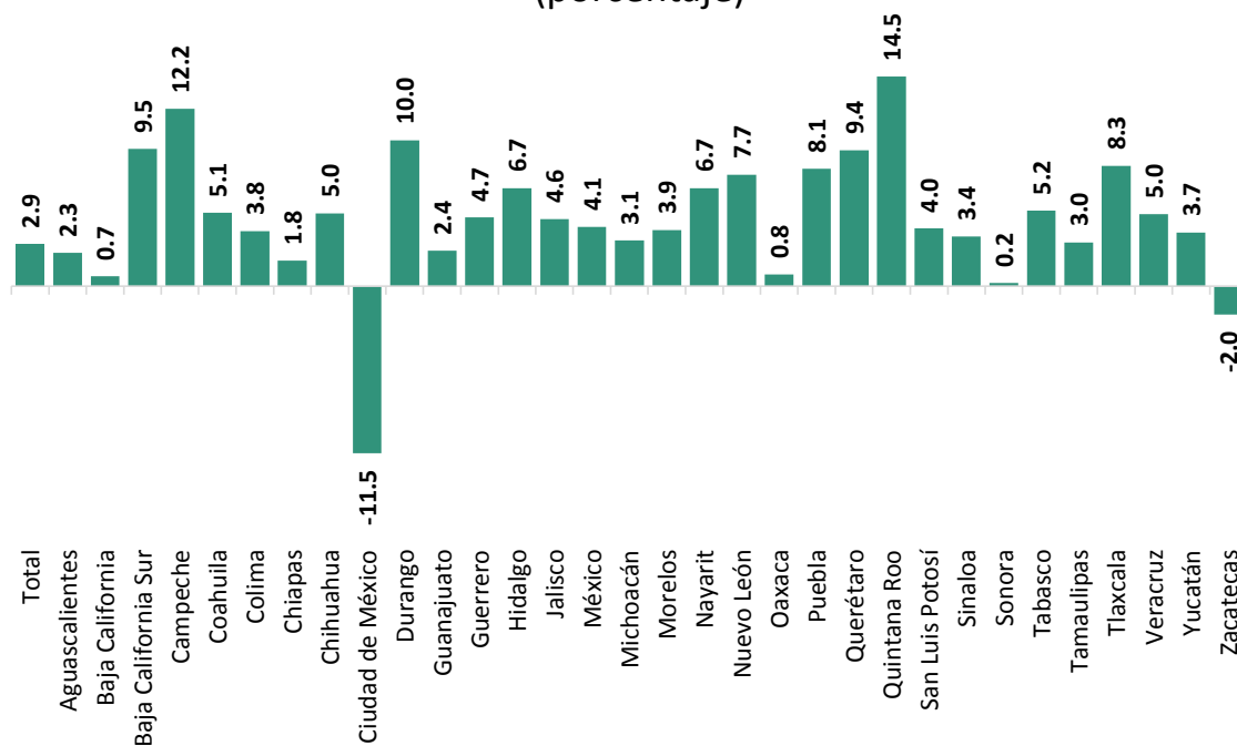
Tasa Anual de Crecimiento Real del Total del Gasto Federalizado Pagado por Entidad Federativa, 2022-2023 (porcentaje)

Fuente: Elaborado por el CEFP con información de la SHCP.