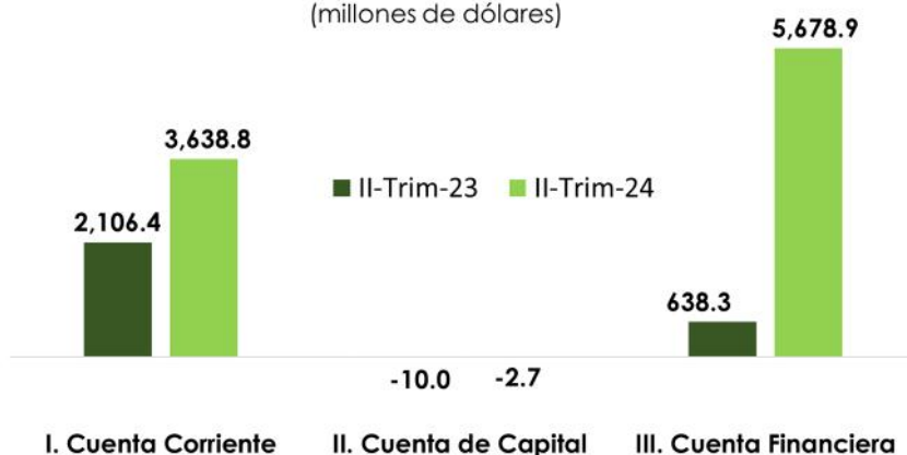
Saldos de las Principales Cuentas de la Balanza de Pagos, 2023-2024/II Trim. (millones de dólares)

Fuente: Elaborado por el CEFP con datos del Banco de México.