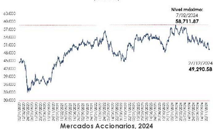
Índice de Precios y Cotizaciones (IPC) México, 2020 - 2024 / Diciembre (Unidades)

En el periodo indicado, los mercados de valores a nivel mundial registraron movimientos mixtos: el índice Dow Jones de Estados Unidos terminó en 42 mil 992.21 unidades, lo que representó un ascenso de 0.35%. En Europa, las plazas bursátiles de Francia, Inglaterra y España avanzaron 1.11, 0.81 y 0.56%, respectivamente. Por su parte, en América Latina, el mercado accionario de Argentina reportó un alza de 4.46%; en tanto que el de Brasil exhibió una reducción de 1.50%.