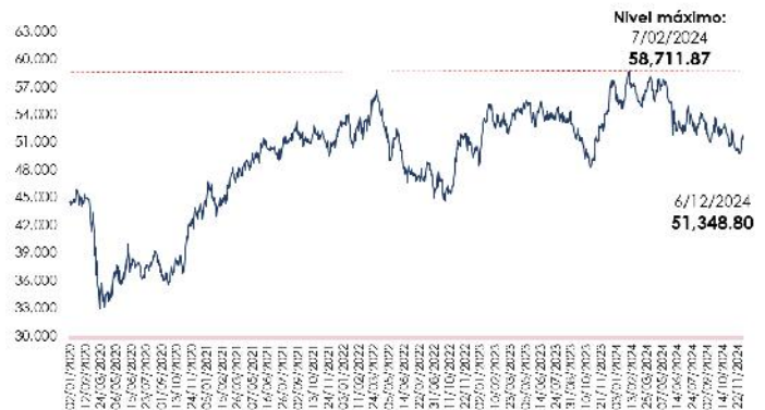
Índice de Precios y Cotizaciones (IPC) México, 2020 - 2024 / Diciembre (Unidades)

Nota: Con datos al 6 de diciembre de 2024.