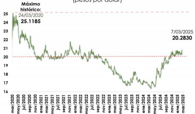
Tipo de Cambio FIX, 2020 - 2025 / Marzo (pesos por dólar)

Del 28 de febrero al 7 de marzo de 2025, el peso mexicano registró una apreciación semanal de 1.10%, lo que representó un decremento de 22 centavos en el tipo de cambio FIX, al pasar de 20.5080 a 20.2830 pesos por dólar (ppd); su primera recuperación después de acumular cuatro semanas consecutivas de pérdidas para la moneda local.