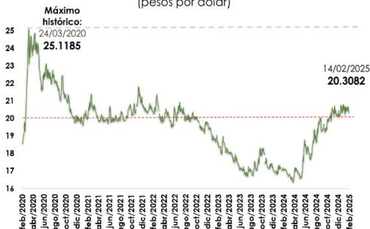
Tipo de Cambio FIX, 2020 - 2025 / Febrero (pesos por dólar)

Nota: Con datos al 14 de febrero de 2025.