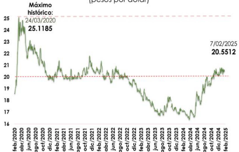
Tipo de Cambio FIX, 2020 - 2025 / Febrero (pesos por dólar)

Nota: Con datos al 7 de febrero de 2025.