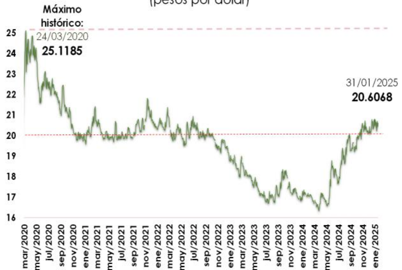
Tipo de Cambio FIX, 2020 - 2025 / Enero (pesos por dólar)

No obstante, al 31 de enero de 2025, el peso mexicano reportó una apreciación de 0.86% (-18 centavos) respecto al tipo de cambio del cierre de 2024 (20.7862 ppd). En el primer mes del año, la paridad cambiaria tuvo un valor medio de 20.5490 ppd, nivel superior al promedio observado en el mismo lapso de 2024 (17.0873 ppd).