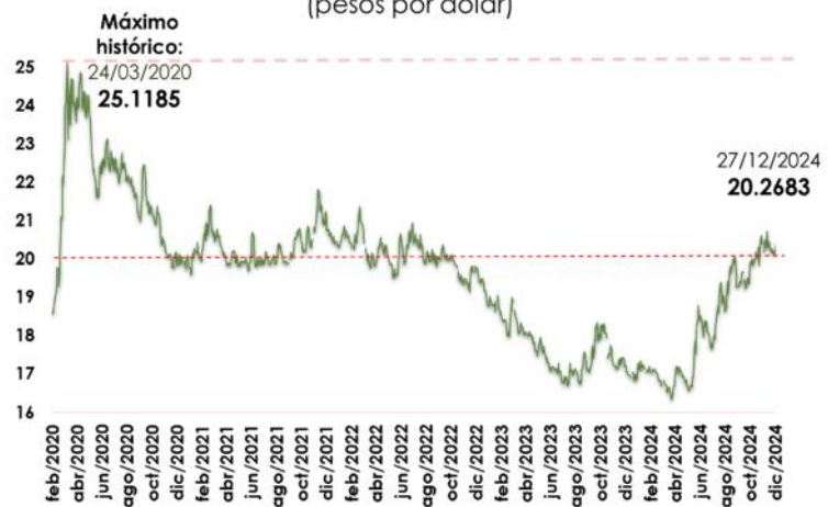
Tipo de Cambio FIX, 2020 - 2024 / Diciembre (pesos por dólar)

Nota: Con datos al 27 de diciembre de 2024.