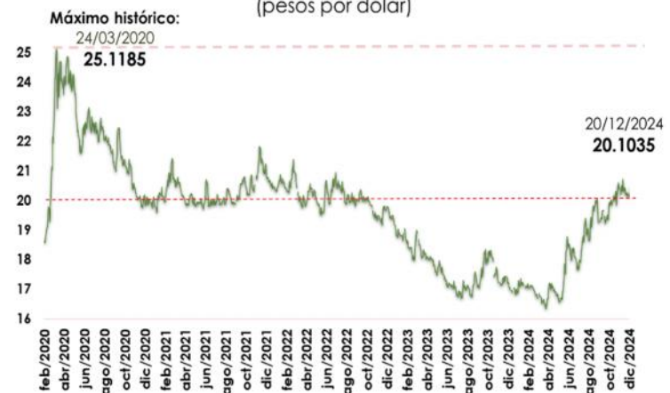
Tipo de Cambio FIX, 2020 - 2024 / Diciembre

Nota: Con datos al 20 de diciembre de 2024.