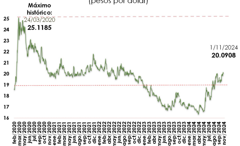
Tipo de Cambio FIX, 2020 - 2024 / Noviembre (pesos por dólar)

Nota: Con datos al 1 de noviembre de 2024.