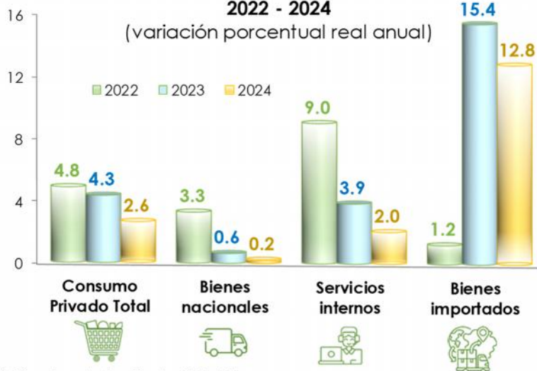
Consumo Privado en el Mercado Interior 1/ 2022 - 2024 (variación porcentual real anual)

1/ Cifras desestacionalizadas, 2018=100. Fuente: Elaborado por el CEFP, Ifigenia Martínez y Hernández con información del INEGI.